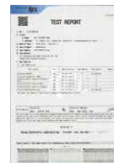
위생용품 시험 성적서 (KCL Test Report)