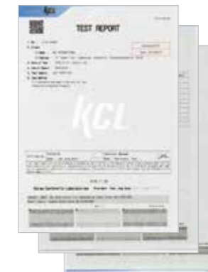
위생용품 시험 성적서 (KCL Test Report)