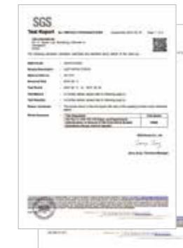
미 FDA 시험 통과