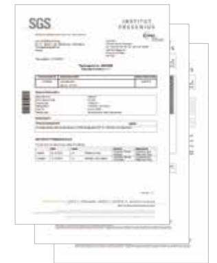
유럽 식품용품 인증시험 통과