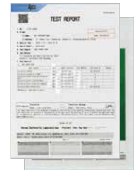
위생용품 시험 성적서 (KCL Test Report)