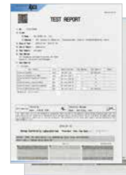
위생용품 시험 성적서 (KCL Test Report)